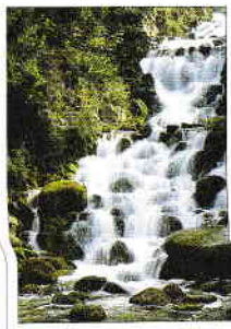
Viktoriapark in Kreuzberg

Acest mic parc înconjură în trecut palatul Monbijou. Aici există un bust al scriitorului și naturalistului german Chamisso (p. 37).