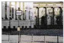
Alte Bibliothek din Bebelplatz

Una dintre marile clădiri baroce ale Berlinului, Vechea Bibliotecă a fost construită în 1775 de Georg Christian Unger pentru colecția bibliotecii regale. Proiectul lui s-a bazat pe un plan mai vechi al lui Fischer von Erlach pentru Vienna Hofburg. Clădirea acăpostește Facultatea de Drept a Universității Humboldt.