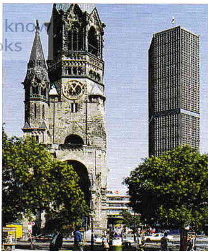
Vechea și noua Kaiser-Wilhelm-Gedächtniskirche