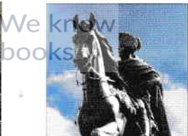
Statuia lui Frederic cel Mare