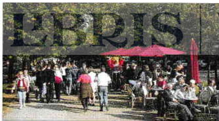
Unter den Linden, un mare bulevard încadrat de lămi