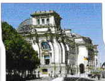
Reichstag, cu noua cupolă

Construită între 1884–1894 de Paul Wallot pentru a găzdui parlamentul german, Reichstagul are o cupolă de fier și adăugată de Norman Foster (p. 53).