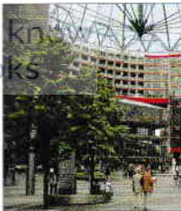
Hesperomuseum, Centru Sony