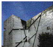
Jüdisches Museum in Kreuzberg

Berlin este una dintre cele mai fascinante capitale ale lumii. În nici un alt loc arta, și cultura, distracția și viața de noapte nu sunt mai diversificate și mai captivante ca pe malurile râului Spree.